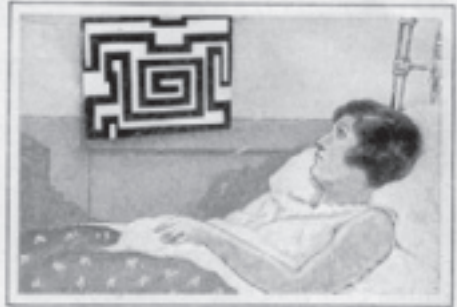
Following lines on this design five or ten times at night will induce sleep. This method was employed by ancient Indians.

If you are troubled with insomnia, try this method on yourself. Simply take a sheet of cardboard about 12 in. by 18 in. and paint on it the lines illustrated in the photo. Five to ten trips around will bring slumber.